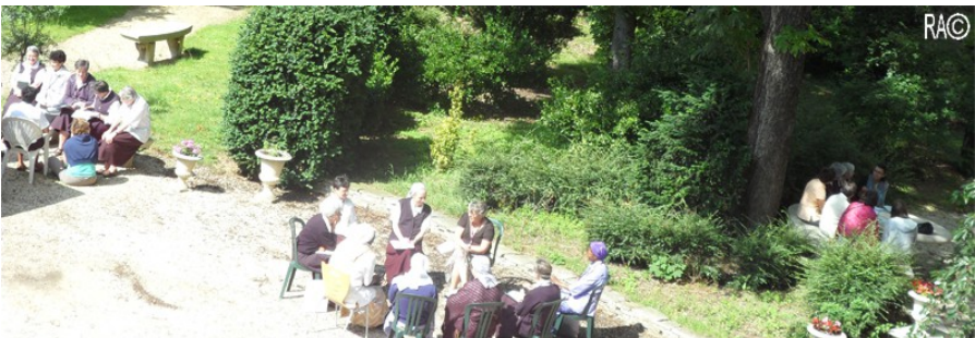
Travaux de groupe en Assomption, laïcs et sœurs, ce matin